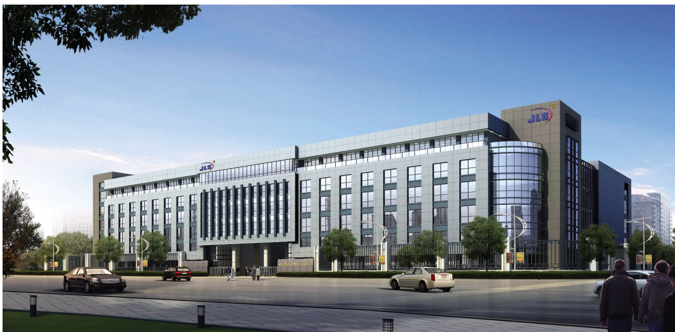
杭州捷尔思阻燃化工有限公司新厂房效果图

量、服务”的理念,无卤阻燃技术处于国内领先水平,其中Ⅱ型多聚磷酸铵已成为全球三大生产商之一。2012年,全球经济整体迟缓,捷尔思公司领导及时决策,调整方向,开发国内市场和南美中东等新兴市场,改变销售策略,从做产品转向做项目,投身杭州电动汽车配套阻燃电池等项目,取得良好开端。2012年,完成销售额1.56亿元(含税),比2011年增长6.8%,整体效益基本与2011年持平。研发项目获浙江省科技进步三等奖1项,杭州市科技进步二等奖1项,国家发明专利2项,申请5项授权2项,国家重点新产品1项,热塑性聚氨酯弹性体TPU专用无卤膨胀型阻燃剂被列为国家中小企业创新基金重点项目,电动汽车动力锂电池高性能环保型阻燃高分子材料获杭州重大科技创新专项。同时,浙江省省级外贸公共服务平台获批准,成立杭州市企业技术中心,获市著名商标,省出口名牌,省专利示范企业等荣誉。捷尔思公司在8月通过中国质量协会的审核,获“质量环境安全职业健康”三体系证书。在生产制造中,通过加大投入改造设备,使生产效率和产品质量提高。经过截污纳管施工和设备降噪处理,通过市环境检测站环境检测,达到合格排放,取得技改项目环保、卫生、消防“三同时”验收报告。捷尔思公司始终坚持“自主创新”和“自有品牌”的发展战略,坚持创新活动结合市场的发展理念,重视新产品的开发与创新,建有一个省级