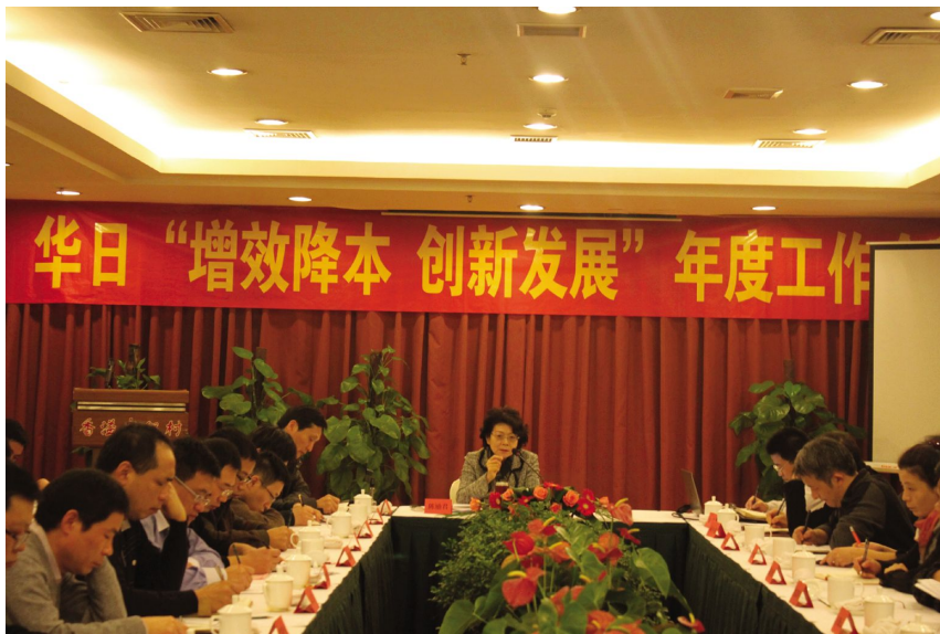
12月1日,开展“增效降本”活动

断提高华日电冰箱公司的产品市场占有率。2012年,华日电冰箱公司生产经营平稳增长,企业持续良性发展。华日电冰箱公司50种产品入围国家“节能产品惠民工程高效节能电冰箱推广目录”;华日电冰箱公司被列入“2012年中国节能产品企业领袖榜”,获“2012年中国优秀工业设计奖”、全国冰箱行业的品质“标杆”奖、“智能冰箱之星”和“经典三门冰箱之星”。2012年,华日电冰箱公司再次获中国家用制冷电器具制造业排头兵企业、中国家用制冷电器具制造业科技创新企业;获浙江省专利示范企业、浙江省家电“以旧换新”政策实施工作先进单位和杭州市上城区政府质量奖等荣誉;连续多年获全国优质服务先进单位和浙江省信用管理示范企业称号。