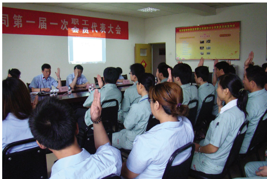
5月22日,召开潍坊分公司第一届一次职工会员代表大会

同时,先期预捐现金1000万元用于“筑巢行动”的启动和开展,截至12月底,援建学校覆盖6省18县38所学校。娃哈哈集团希望通过这次活动,真正帮助贫困地区的儿童;同时也希望以此倡导全民公益、透明公益的理念。