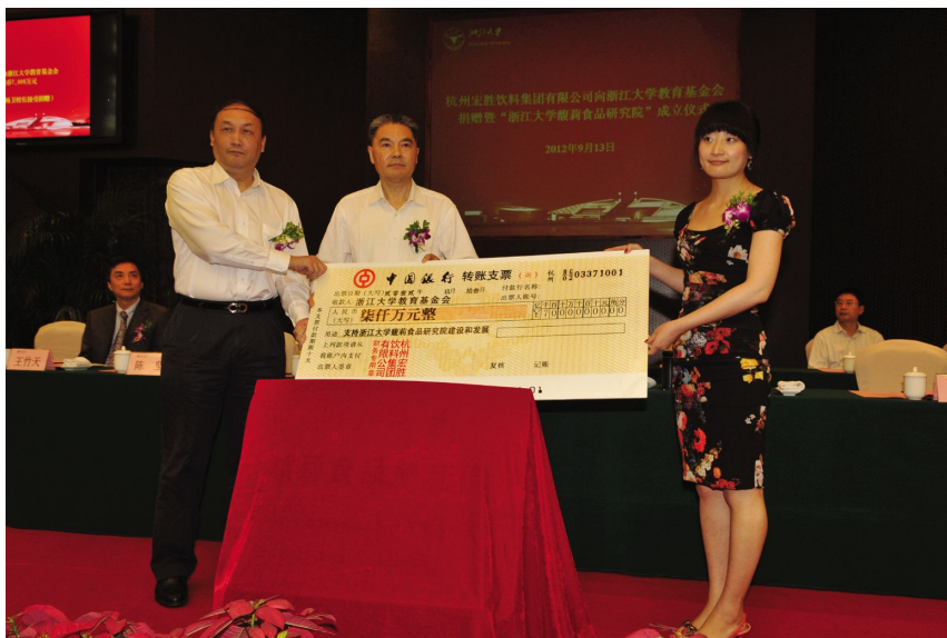
9月13日,浙江大学馥莉食品研究院成立 (杭州娃哈哈集团有限公司 供稿)

【杭州华日电冰箱股份有限公司概况】 2012年,国内家电市场复杂多变,呈现新格局。杭州华日电冰箱股份有限公司(以下简称华日电冰箱公司)充分发挥自身专业制冷优势,不断地强化管理,提升管理水平,引进和采用现代科技为产业发展服务,以技术创新为主线,推进企业的技术进步和产业创新,引用家电制冷的前沿技术和核心技术,开发更多具有市场竞争力的产品。进一步提升企业的运行质量和“增效降本”工作,充分调动职工积极性和创造性,提高企业抗市场风浪的能力。组织开展全国范围内各种形式的新品展览会和促销服务宣传活动,巩固和开拓新的市场,不