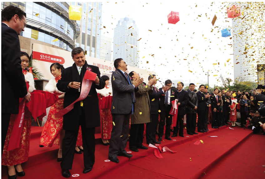
11 月 29 日,举行娃哈哈娃欧商场开业典礼(杭州娃哈哈集团有限公司 供稿)

【杭州娃哈哈集团有限公司概况】 2012 年,杭州娃哈哈集团有限公司(以下简称娃哈哈集团)完成饮料产量 1232.79 万吨,完成产值 452.88 亿元,实现营业收入 636.31 亿元、利税 139.34 亿元、利润 101.10 亿元。2012 年,娃哈哈集团荣列 2012 中国民营企业 500 强第 16 位、2012 中国民营企业制造业 500 强第 10 位、2012 中国制造业企业 500 强第 71 位,中国企业效益 200 佳第 25 位。获全国就业先进企业、全国轻工业卓越绩效先进企业特别奖、浙江省民营企业思想政治工作创新奖、杭州市工资集体协商十佳单位、上城区政府质量奖等荣誉。